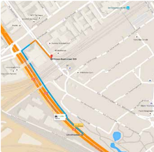
Vanaf de Utrechtse Baan (A12)

Vanaf de N44/A44 vanuit de richting Voorburg, Wassenaar, Leiden en Amsterdam, slaat u linksaf richting Voorburg/Leidschendam. U komt dan op de Laan van Nieuw Oost Indië. Sla rechtsaf de Schenkkade op. Op het tweede kruispunt met verkeerslichten slaat u linksaf de Prinses Beatrixlaan op. De ingang van de parkeergarage bevindt zich aan uw rechterhand, vlak voor het viaduct.